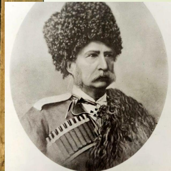
Офицеры 2-го Кубанского казачьего полка